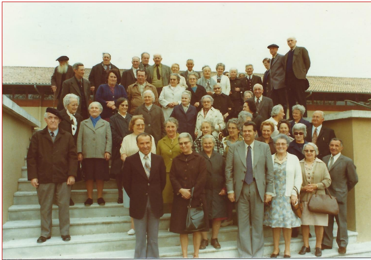
Photo souvenir du « Cercle de l'Amitié » en voyage (mai 1975) Reconnaissez-vous ces « Mottois » ? - A vous de jouer...

Mairie de La Motte Chalancon (26470) Tél : 04.75.27.20.41 Courriel : mairie@lamottechalancon.com Site Web : www.lamottechalancon.com